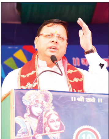
■ खनसर घाटी के लिए मुख्यमंत्री ने की विभिन्न घोषणाएं

खनसर घाटी स्थित माईथान पहुंचे मुख्यमंत्री, जन्माष्टमी महाकौथिग” कार्यक्रम में किया प्रतिभाग