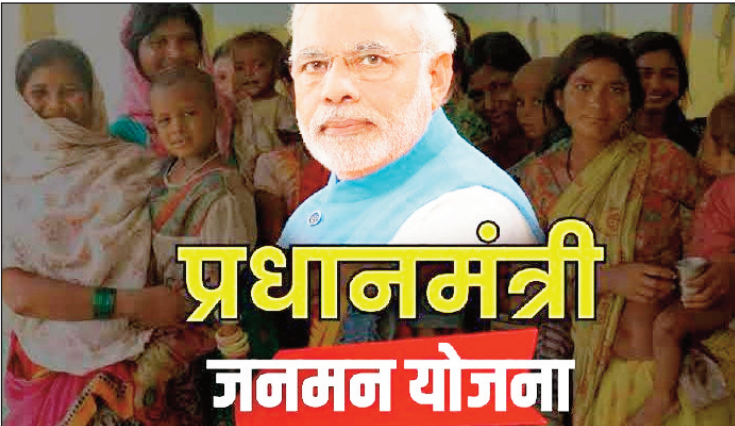
न्यूज़ वायरस नेटवर्क

देहरादून 24 अगस्त : देश भर के 194 जिलों में विशेष रूप से कमजोर जनजातीय समूहों (पीवीटीजी) की बस्तियों और पीवीटीजी परिवारों तक पहुंचने के उद्देश्य से, केंद्रीय जनजातीय कार्य मंत्रालय 23 अगस्त, 2024 से 10 सितंबर, 2024 तक प्रधानमंत्री जनजातीय आदिवासी न्याय महाभियान (पीएम-जन मन) के लिए एक राष्ट्रव्यापी सूचना, शिक्षा और संचार (आईईसी) अभियान और लाभार्थी शिविर का संचालन कर रहा है।