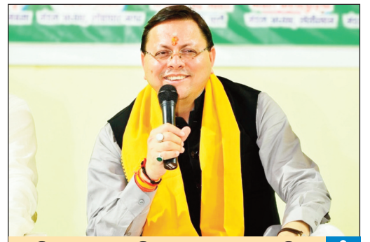
सीएम धामी जम्मू-कश्मीर में करेंगे चुनाव प्रचार