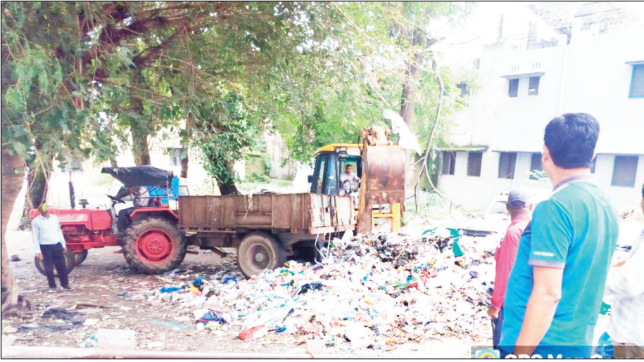
न्यूज़ वायरस नेटवर्क

देहरादून दिनांक 12 सितंबर, जिलाधिकारी सविन बंसल शहर की सफाई व्यवस्थाओं की स्वयं मॉनिटरिंग कर रहे हैं। कूड़ा सम्बन्धी शिकायतों पर नगर निगम के अधिकारियों को त्वरित कार्यवाही के निर्देश दिए गए हैं। नगर निगम में व्यवस्था परिवर्तन का असर दिखा। नगर निगम देहरादून द्वारा राजीव गांधी कॉम्प्लेक्स और नई तहसील परिसर की सफाई के लिए अनुबंधित उड़ा